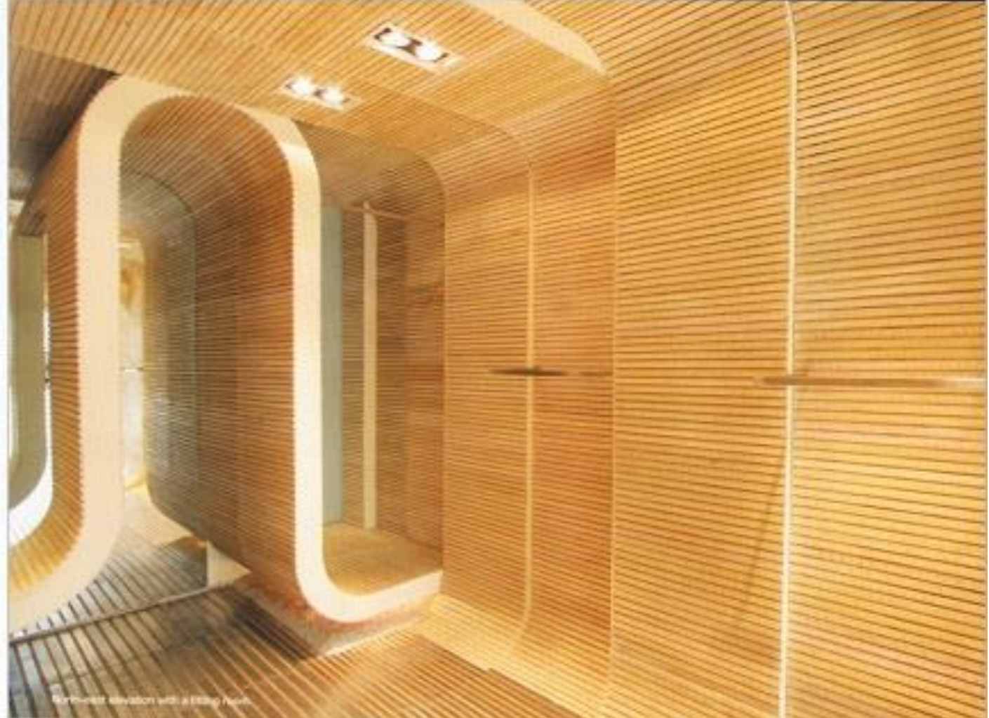
Forward movement with a fitting room