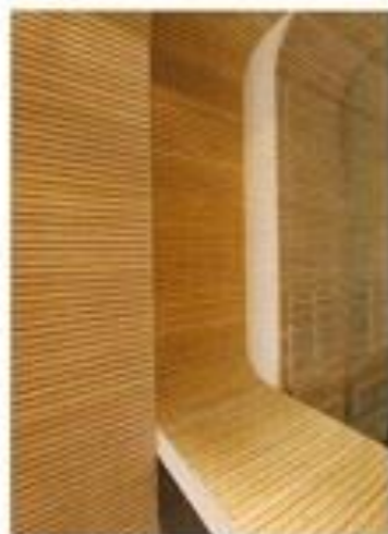
Help and cash desk