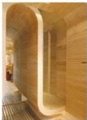
A fitting room